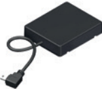
NOVOFERM HOMEMATIC IP MODUL