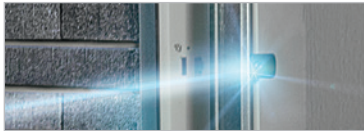
LICHTSCHRANKE FÜR GARAGENTORE